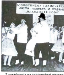
Z vystúpenia na tohtoročnej obecnej prehládke folklorných tradícií v Plandišti