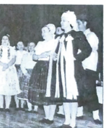
Z vystúpenia na tohtoročnej obecnej prehládke folklorných tradícií v Plandišti

mu kultúry ktorý je po chúlšovom atave a čoraz raššie sa tam robí. Nemôžu sa pochváliť ani skvelou finančnou situáciou. Sice z rozpočtu