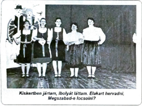
Kiskertben jártam, lólyólat láttam. Elakart hervadni, Magszabad-e locsolni?